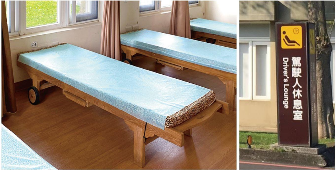
附圖 3：高速公路局湖口服務區提供之駕駛人休息室