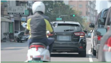
影片來源：和安保險代理人

❖ 當非常接近違停車輛且後方有來車時，我應該減速或煞停讓其他車輛先通過再變換車道繞過它。