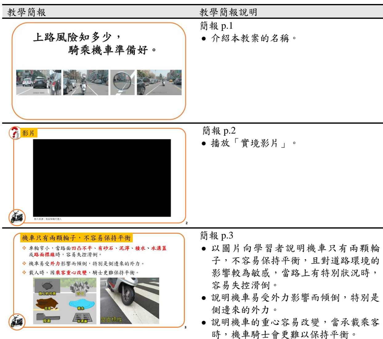
表 1-3 教案一「上車風險知多少，騎乘機車準備好」 教學簡報說明

承上所述，本教案於教學流程中所使用的教具包含：教案一前測與後測問卷(前測與後測問卷分別詳見附件一與附件二) 及教案一教學簡報(內容說明詳見表 1-3)。